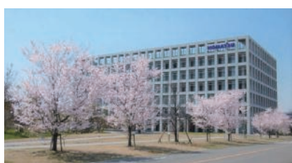
日本花の会 事務局