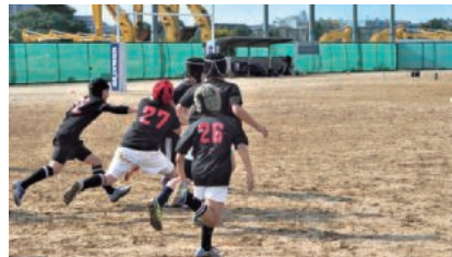
屋外グラウンド(地域への開放)