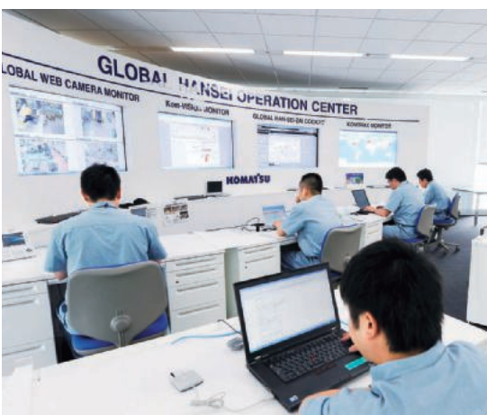
グローバル販生オペレーションセンター Global HANSEI Operation Center

Global HANSEI Operation Center grasps market trends and plans and manages production, sales, and inventory with the aim of maximizing sales of construction machinery, optimizing inventory and improving serviceability to our customers. Using the system "KOMTRAX" for checking machine information remotely, we support operation management and maintenance management by collecting and analyzing data from construction machinery in the world.