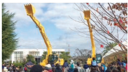
工場開放フェスティバル