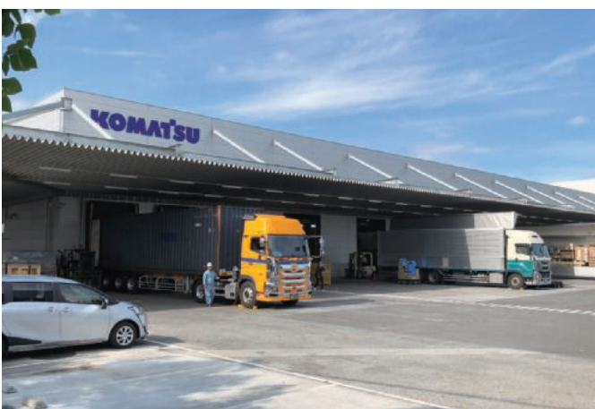
関西補給センター Kansai Spare Parts Distribution Center

As a global center for spare parts required for inspection, maintenance, repair, vehicle inspection, etc. of construction, mining and industrial machinery, Kansai Spare Parts Distribution Center ship to domestic and overseas bases. A new work building was completed in July 2020, and the work process was consolidated and a global standard inventory management system and the latest ICT equipment were introduced. We contribute to life cycle support of our customers by stable supplying of after-sales parts to maintain the operation of machines under urgent breakdowns and troubles and daily maintenance.