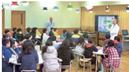
地域小学生対象理科教室