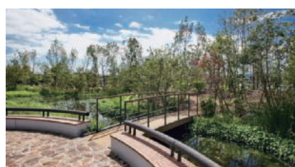
里山公園(地域への提供公園)

環境に配慮した都市型工場として、最新鋭の省エネ設備を備えた大阪テクニカルセンターを設立。地域生態との調和を目指した里山作り、構内の緑化活動等を実施しています。また、工場開放フェスティバルや理科教室を開催し、地域住民との交流を図っています。