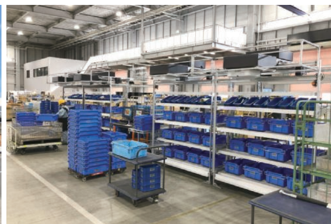
国内作業仕分けをする PAS システム Projection Assorting System