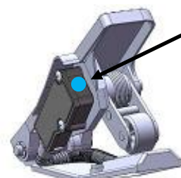
水色ペイントを塗布する